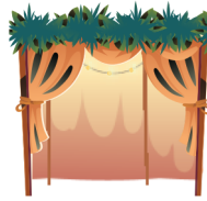
חג הסוכות Sukkot

When the Jewish people left Egypt, the Clouds of Glory protected them. To remember this miracle, you build me after Yom Kippur, decorate me and sit in me for seven days. What am I?