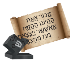
הנחת תפילין Putting on Tefillin

You receive me at a Bar Mitzvah and put me on your head and arm. I contain 4 sections from the Torah which talk about the Exodus from Egypt. What am I?