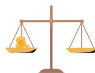
ישר במידות ובמשקלות Being honest as a person and in business

The Jewish people left Egypt and were told not to behave like the Egyptians. The Jewish people need to behave honestly, and should not deceive or steal. What am I?