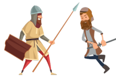
המלחמה בעמלק The war against Amalek

When the Jewish people left Egypt, a people living in the desert waged war with them. The Exodus from Egypt and this war may not be forgotten, according to the Torah. Who am I?