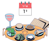
פסח שני Pesach Sheni

I am a special festival for whoever didn't celebrate Pesach in the month of Nissan. Whoever was too far away or didn't manage to celebrate in Nissan, celebrates me on the 14th of Iyar. I am not the first Pesach. What am I?