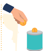
מתנות עניים Giving to the poor

I am an important Mitzva to do with giving. When you see a person who is lacking, or who is in trouble, I appear. When the Jewish people were in Egypt, no-one saw them or helped them. In memory of the Exodus from Egypt, we need to remember that we are all equal and that we must look around us and help the poor. What am I?