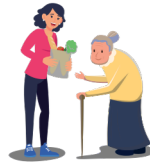
עזרה לגר ליתום ולאלמנה Helping a convert, orphan or widow

The Jewish people were strangers in Egypt and we therefore need to show empathy and help those who are new in our surroundings and those who don't have close relatives to help them, such as the orphan and the widow. Who am I?