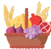
ביכורים Bringing the first fruits to the Temple

From the time of Shavuot, the farmer would gather the first fruits from his trees, put them in a basket, and bring them up to Jerusalem. He understood that every fruit was special and said thank you for it, mentioned the Exodus from Egypt which resulted in the Jewish people returning to their land, and ate the rest of his fruits with joy. What am I?