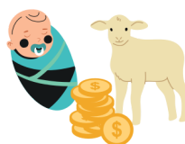
מצוות פדיון בכורות Redeeming the firstborns

During the plague of the Firstborns in Egypt the firstborn Egyptians died, but the firstborn Jews were saved. To remember this miracle, whenever a firstborn boy is born, we say thank you and give silver coins. What am I?